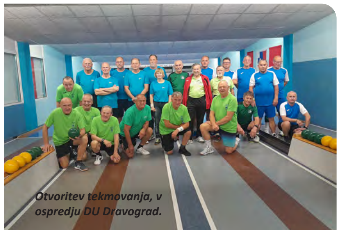
Otvoritev tekmovanja, v ospredju DU Dravograd.

Po končanem memorialu so bili podeljeni tudi pokali, medalje in priznanja za končano kegljaško sezono. Za odlično izvedbo memoriala in v zadovoljstvo prek 60 kegljačev gre zahvala DU Dravograd, Kegljaškemu klubu Dravograd, Športni zvezi Dravograd ter sponzorju Koroške pekarnice. Zahvaljujemo se tudi gostišču