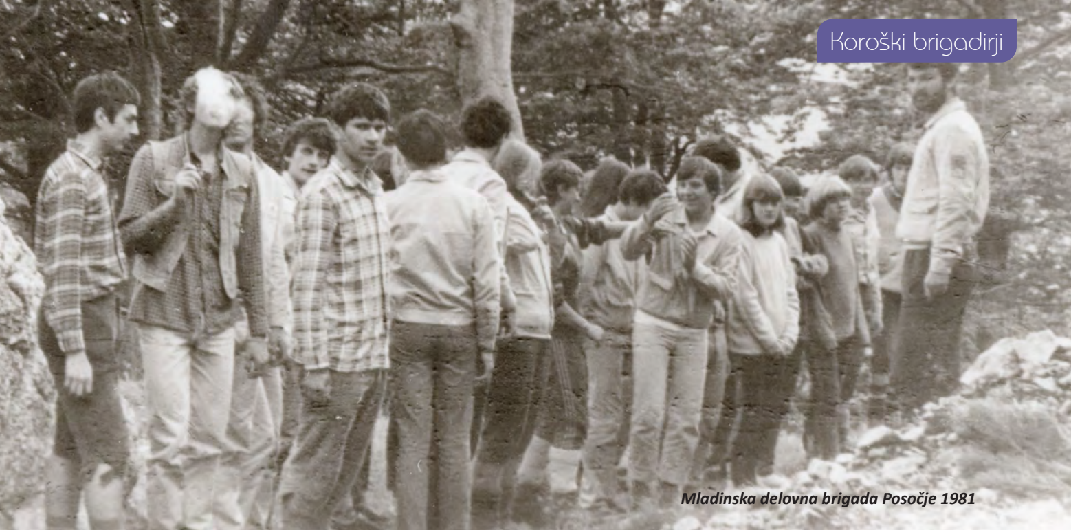
Mladinska delovna brigada Posočje 1981