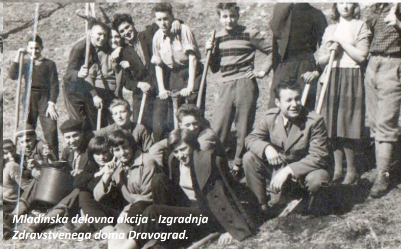
Mladinska delovna akcija - Izgradnja Zdravstvenega doma Dravograd.

mestitvijo spominskih plošč (kar sedem) v zahvalo brigadirkam in brigadirjem, ki so bili udeleženi na določenih akcijah, se udeleževali dogodkov na povabila drugih društev oz. klubov po Sloveniji in tujini ter zbirali gradivo za arhiv iz brigadirskih časov.