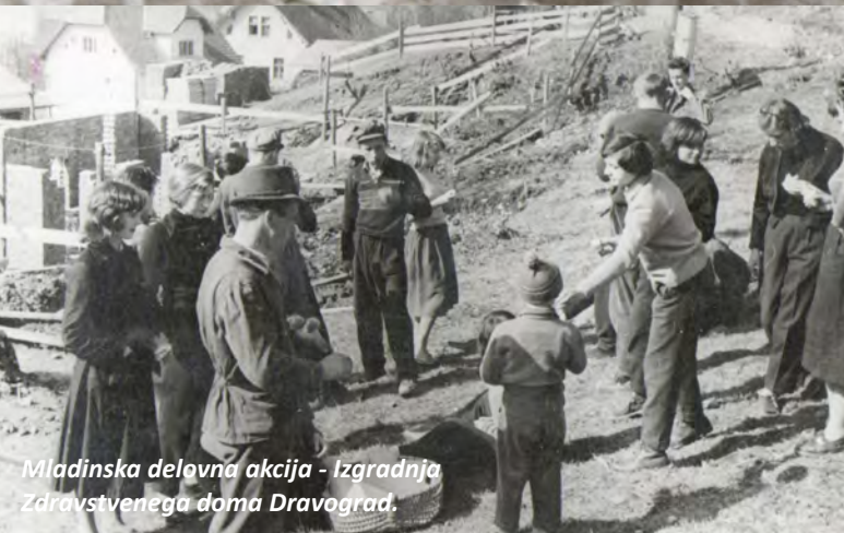
Mladinska delovna akcija - Izgradnja Zdravstvenega doma Dravograd.